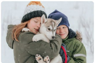
ACTIVE "Dod ķepu" hyskies