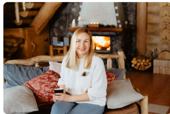
Guest house "Kalniņi"