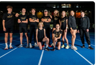
ACTIVE Sports club "Ašais"