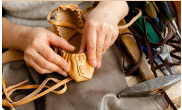
CREATIVE Drabeši Manor