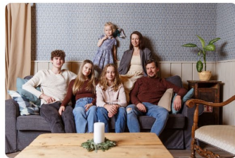
Holiday house "Virgabali"