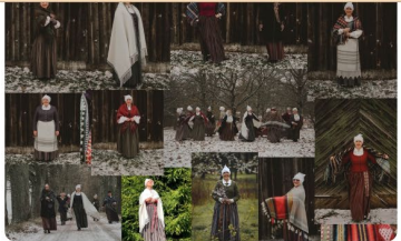
CREATIVE Weavers collective "Aušas"