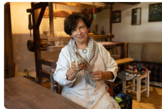
Holiday house "Dzērves"