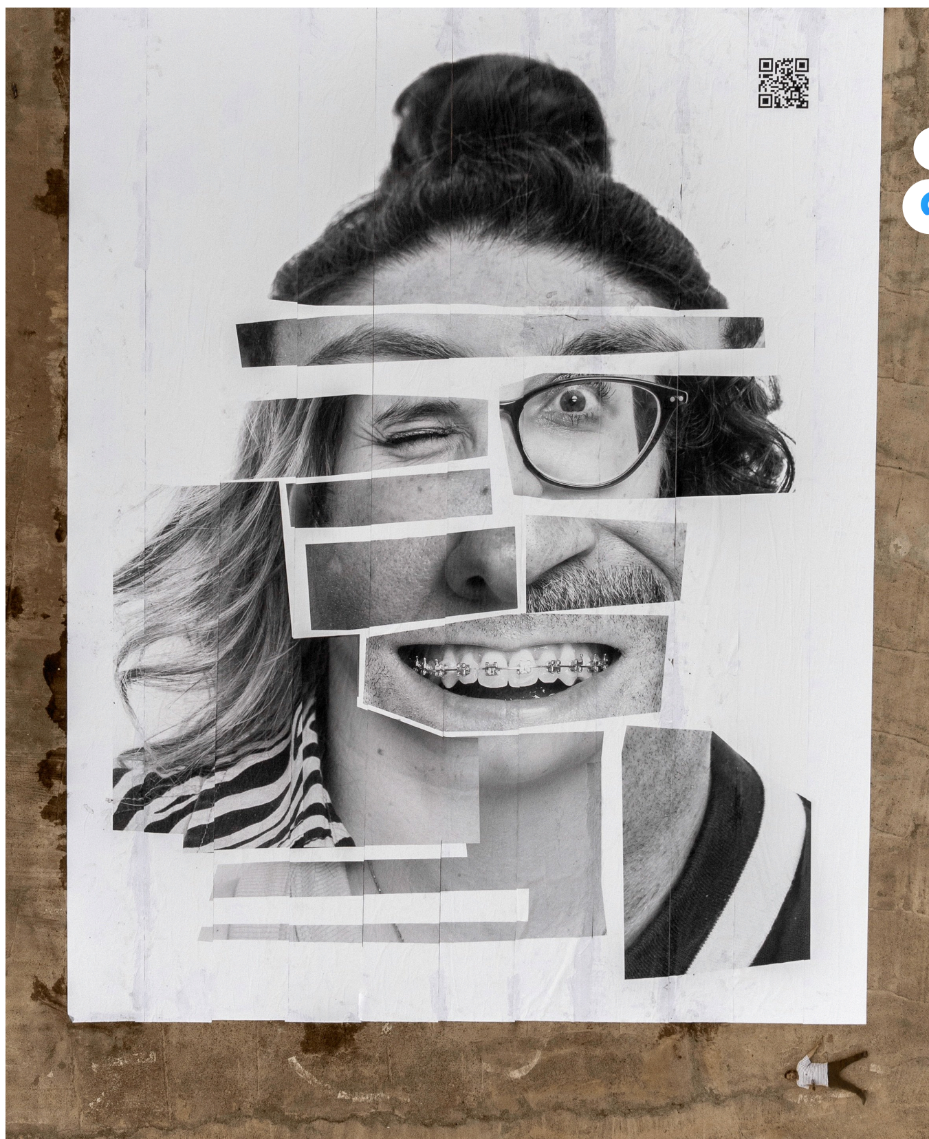
La obra "Diversity" con vista de dron.